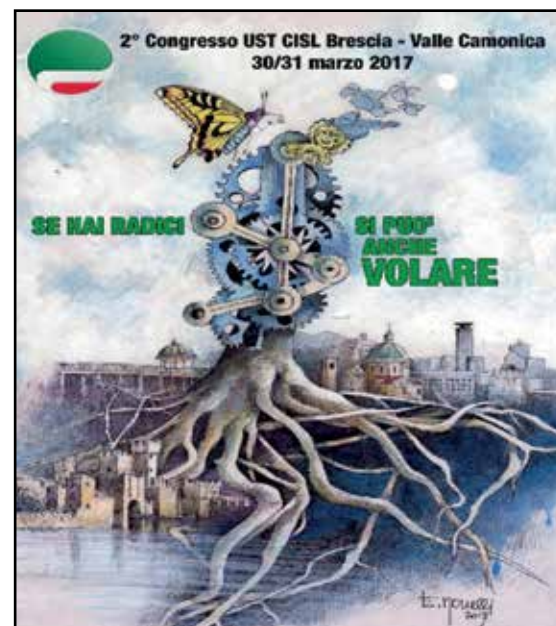
Il manifesto del congresso affisso anche a Montichiari.