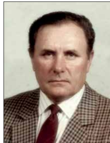
Giovanni Bellini 1° anniversario