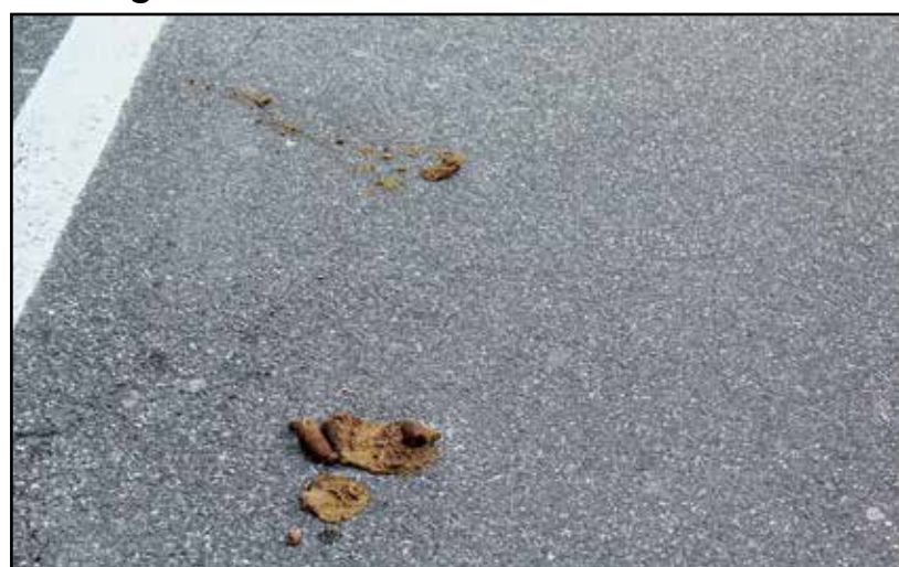
Il risultato dopo il passaggio di un ragazzo "sbadato".

Una ennesima "montagnetta" di escrementi lasciati per strada da un cane ed ecco la scena: due fratelli, con ognuno