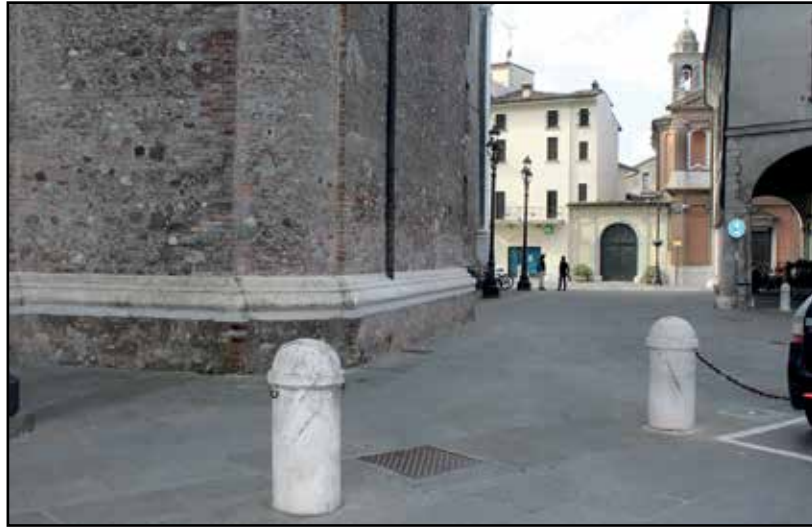
Piazza S. Maria dove entra il corteo funebre.

"Con questa fotografia vogliamo proporre al Comando