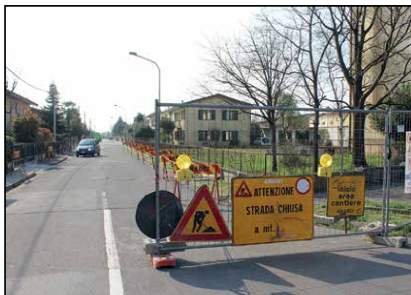
L'inizio dei lavori di sistemazione dei marciapiedi da via Pace.

Un degrado che dopo oltre cinquant'anni doveva avere finalmente attenzione per rendere più sicuro l'utilizzo dello spazio da parte dei pedoni. Inizia così un percorso di lavori di rifacimento e di sistemazione del territorio che l'Amministrazione comunale ha in programma nel corso del 2017, riguardanti sia il centro che le frazioni.